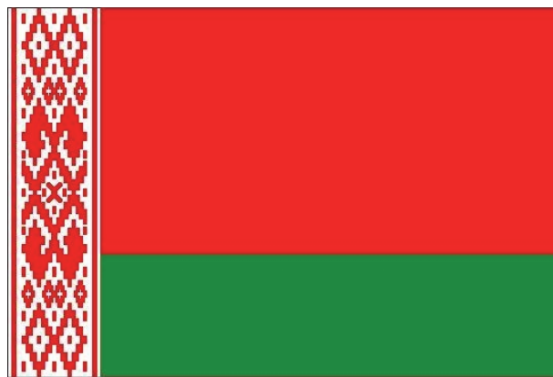
Рис. 1. Государственный флаг Республики Беларусь

тичное описание: «У древка вертикально расположен белорусский национальный орнамент красного цвета на белом поле, составляющем 1/9 длины Государственного флага Республики Беларусь» (рис. 1) [1, 2].