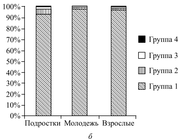
Изменения в структуре ассоциативных полей: а – английский язык; б – белорусский язык

Как уже отмечалось ранее, считается, что одним из основных отличий ассоциативных реакций детей от реакций взрослых носителей языка исследователи признают преобладание синтагматических реакций над парадигматическими в ответах детей и увеличение парадигматических реакций по мере взросления. Ту же тенденцию (основываясь на данных, полученных на материале английского языка) отмечают и при изучении развития значения. Преобладание реакций на основе синтагматических связей характерно для несформированного семантического поля (и при общей несформированности лексической системности). По мере овладения значением происходит важный этап лексического развития: увеличивается количе-